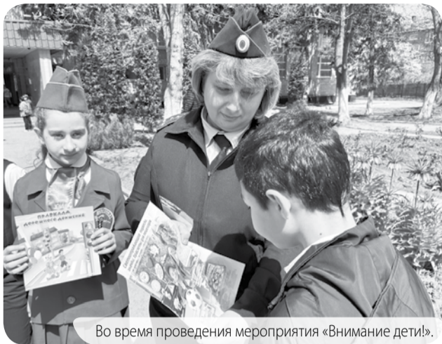
Во время проведения мероприятия «Внимание дети!».

На территории Предгорного округа в период с 17 мая по 2 июня проводится профилактическое мероприятие «Внимание дети!», главная задача которого - снижение детского дорожно-транспортного травматизма, восстановление навыков, связанных с безопасным поведением на улицах и дорогах, а также улучшение адаптации детей и подростков к транспортной среде в местах постоянного жительства, летнего отдыха и учёбы.