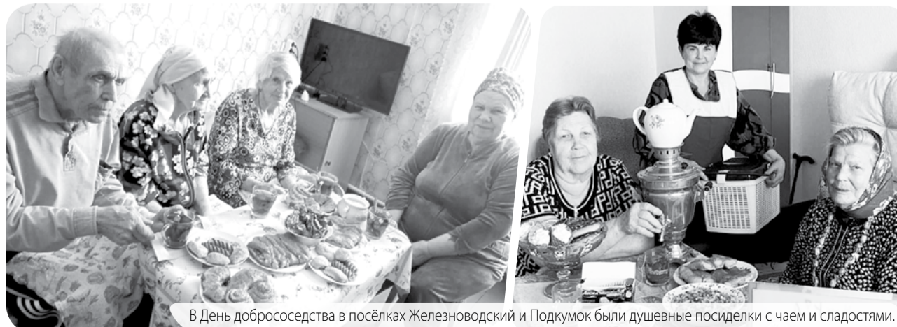
В День добрососедства в посёлках Железноводский и Подкумок были душевные посиделки с чаем и сладостями.