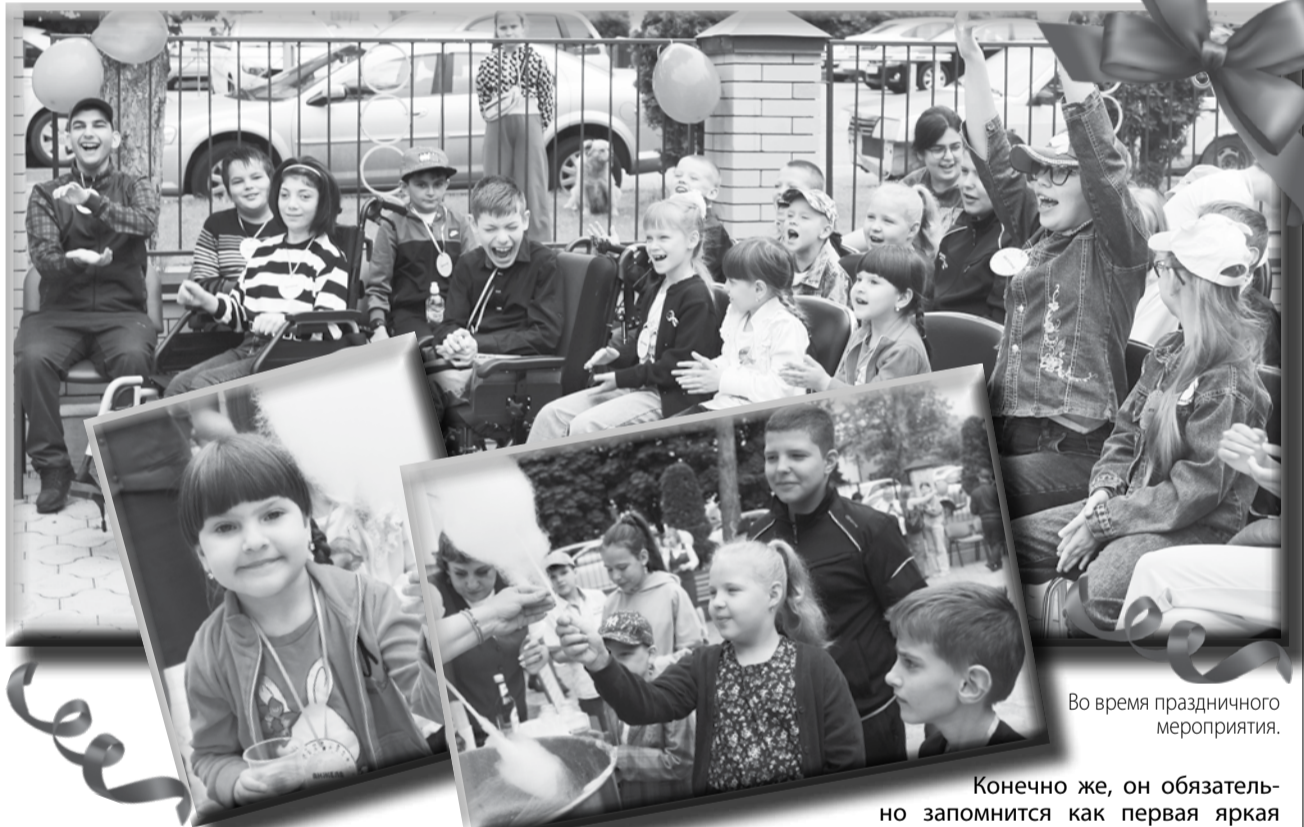
Во время праздничного мероприятия.

Этот прекрасный праздник детства много лет для ребят традиционно проводит наш Центр. Все дети и подростки, которые находятся на обслуживании, с радостью принимают в нём участие. Потому что знают - их ждёт фейерверк счастливых сюрпризов!