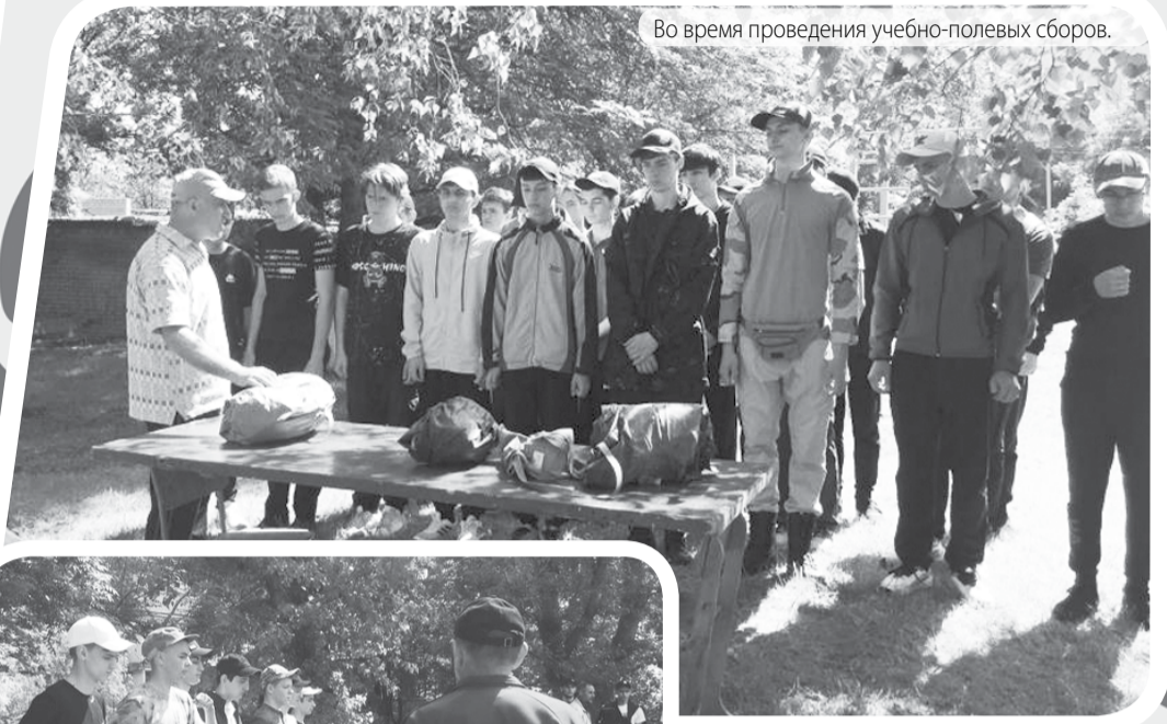
Во время проведения учебно-полевых сборов.