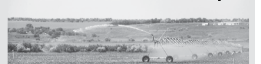
До 2024 года в регионе планируется увеличить площадь орошения на 52 тысячи га.

дождевальных установок, капельного орошения, орошения садов и овощных культур), производя растениеводческую продукцию для внутреннего потребления, так и выращивать экспортноориентированную продукцию: озимую пшеницу, ячмень, рапс, кукурузу на зерно.